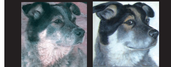
a) = Fotovorlagen b) = Öl Bild